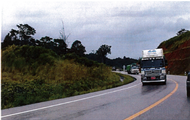
<2015年8月末に開通したミャンマー山岳部を迂回する新バイパス道路>

また、アメリカ経済制裁等の影響を受けている港湾貨物や航空貨物の混乱を避ける第3のルートとしても注目を集めており、国境物流の重要度が更に増すことは間違いないと思われる。